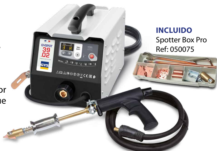
INCLUIDO Spotter Box Pro Ref: 050075

El punto de soldadura se genere automáticamente por un simple contacto entre la herramienta y la parte que alinear.