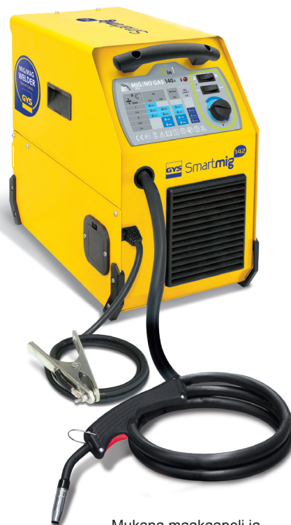
Mukana maakaapeli ja 2 m kiinteä poltin.

Jatkuvasti toimiva puhallin suojaa ylikuumenemiselta.