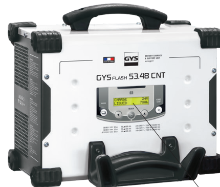
Intuitivno sučelje dostupno na 22 jezika