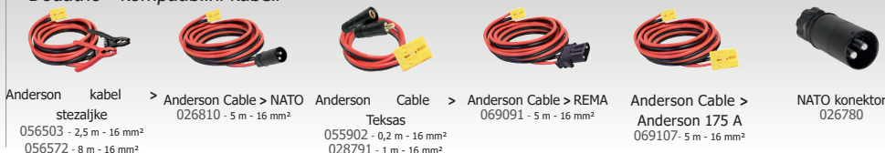
Anderson kabel > Anderson Cable > NATO 056503 - 2,5 m - 16 mm 2 056572 - 8 m - 16 mm 2