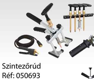
Szintezőrúd Réf: 050693