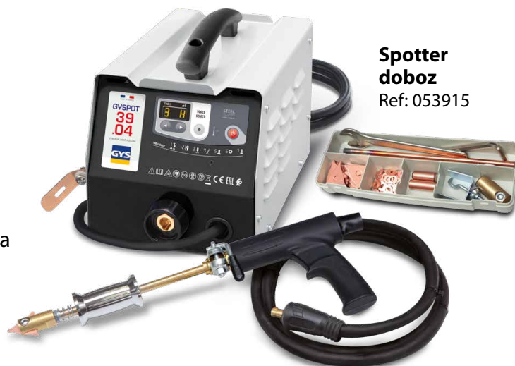
Spotter doboz Ref: 053915

A hegesztés automatikusan elindul a szerszám és a kiegészítendő alkatrész egyszerű érintkezésével.