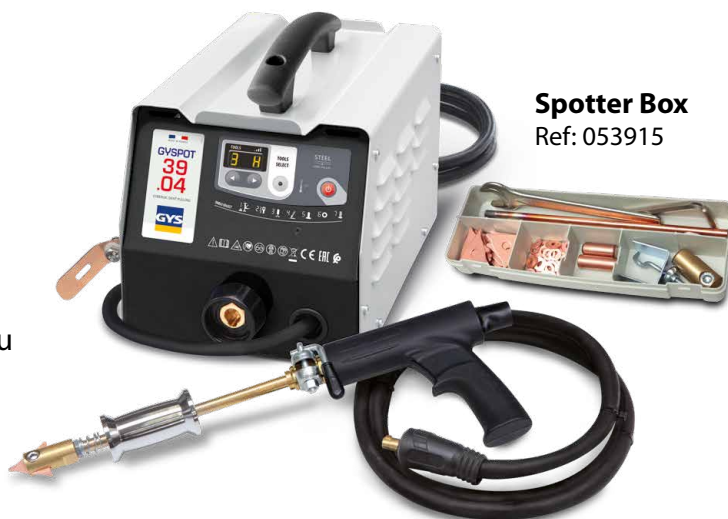
Spotter Box Ref: 053915

Metināšana tiek aktivizēta automātiski ar vienkāršu kontaktu starp instrumentu un taisnojamo daļu.