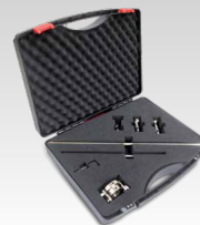
Kit compasso 040205