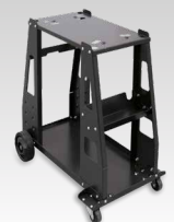
Carrinho PLASMA 600 040298