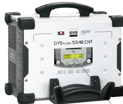
Interfață intuitivă disponibilă în 22 de limbi