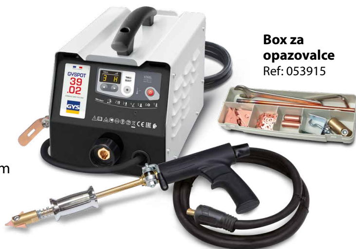
Box za opazovalce Ref: 053915

Varjenje se sproži samodejno s preprostim dotikom med orodjem in delom, ki se ravna.