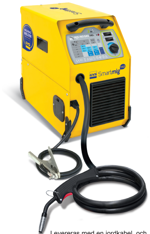
Levereras med en jordkabel och en 2 m fix brännare.

Kontant gående fläkt skyddar enheten mot överhettning.