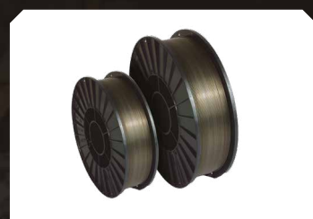
Gevuld draad - staal