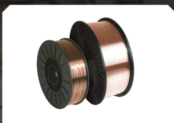
■ Staaldraad (SG2) ■ Inox draad (316LSi)