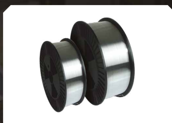
Aluminium draad (AlMg5)